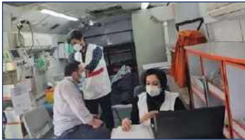
اهمیت سلامت نمازگزاران نماز جمعه در مصالای سمنان ۱۴۰۰/۱۱/۱۸