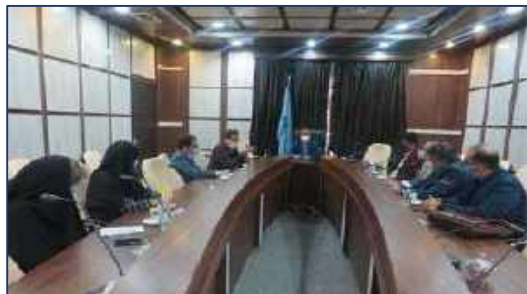
نشست معاون غذا و دارو دانشگاه با مدیران شرکت های پخش دارو ۱۴۰۰/۱۱/۱۳