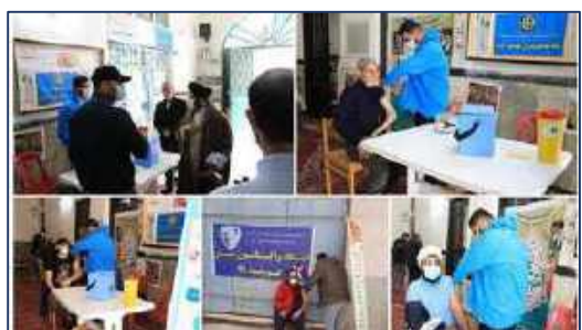
ارائه خدمت واکسیناسیون جهت نمازگزاران نماز جمعه در شهرستان گرمسار ۱۴۰۰/۱۱/۱۶