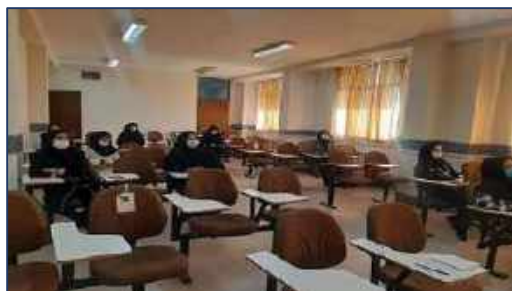
برگزاری جشن بزرگداشت روز زن و تولد حضرت زهرا(س) در شبکه بهداشت و درمان شهرستان سرخه ۱۴۰۰/۱۱/۰۵