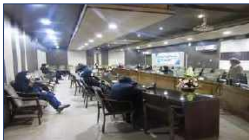
نشست هماهنگی با نمایندگان آموزش شهرستان سمنان برگزار شد ۱۴۰۰/۱۱/۰۹