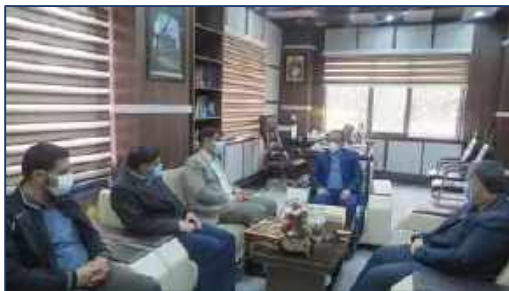
دیدار معاون سلامت و دفاع زیستی سپاه استان سمنان با سرپرست معاونت غذا و دارو دانشگاه علوم پزشکی استان سمنان ۱۴۰۰/۱۱/۱۸