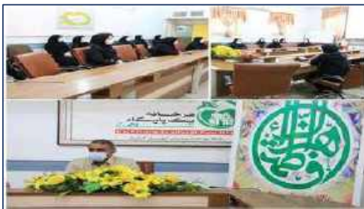
نشست مدیر شبکه بهداشت و درمان شهرستان گرمسار با بانوان شاغل در شبکه به مناسبت روز زن ۱۴۰۰/۱۱/۰۵