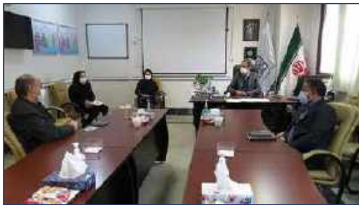
دیدار سرپرست معاونت غذا و دارو و سرپرست اداره تجهیزات پزشکی با مدیرعامل بیمارستان کوثر ۱۴۰۰/۱۱/۱۸