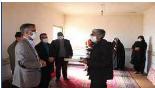
تقدیر از خانواده سخاوتمند نیک اندیش، جان بخش معصومه

سمنان با موضوع واکسیناسیون کرونا ۱۴۰۰/۱۱/۲۳