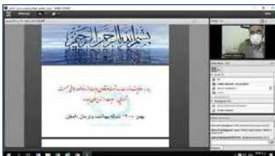
برگزاری وبینار حمایت از خانواده و جوانی جمعیت، شناسایی و