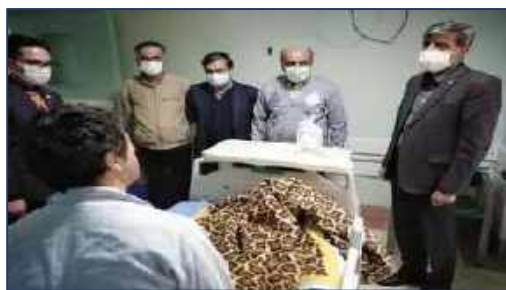
عیادت سرپرست دانشگاه علوم پزشکی استان سمنان از خبرنگار شهرستان دامغان ۱۴۰۰/۱۱/۰۷