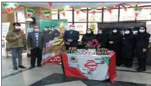
مراسم بزرگداشت ایام الله دهه فجر در مرکز آموزشی پژوهشی و درمانی کوثر ۱۴۰۰/۱۱/۱۳