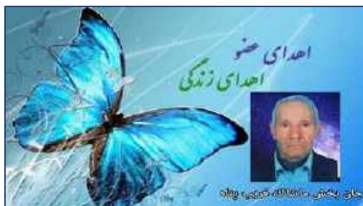
بخششی ماندگار با اهدای عضو پدر مهربان گرمساری ۱۴۰۰/۱۱/۲۷