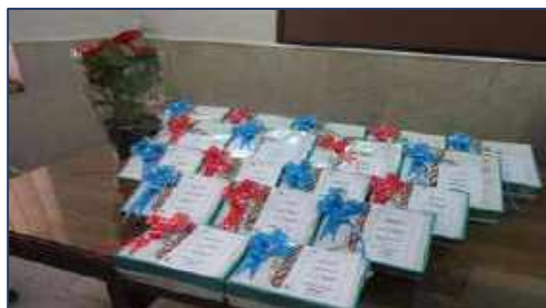
شیرینی کام مدافعان سلامت مرکز بهداشت شهرستان سمنان در سالروز میلاد حضرت زهرا(س) ۱۴۰۰/۱۱/۰۵