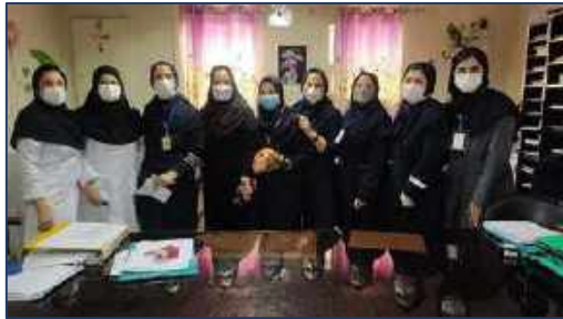
گرامیداشت مقام زن و روز مادر توسط سرپرست مرکز آموزشی پژوهشی درمانی امیرالمومنین (ع) ۱۴۰۰/۱۱/۰۵