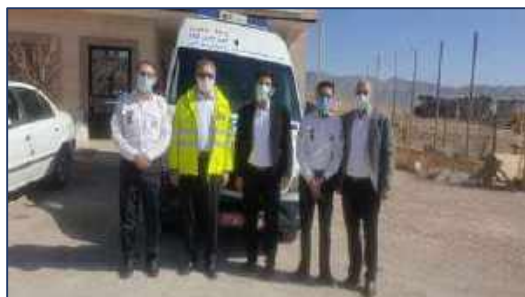
بازدید سرپرست اورژانس پیش بیمارستانی و مدیر حوادث دانشگاه از پایگاه های اورژانس پیش بیمارستانی شهرستان مهدیشهر ۱۴۰۰/۱۱/۳۰