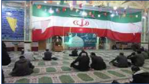
حضور رئیس مرکز بهداشت شهرستان سمنان در برنامه ۱۰ شب ۱۰ مسجد ۱۴۰۰/۱۱/۱۷