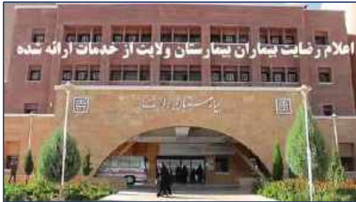
اعلام رضایت بیماران بیمارستان ولایت از خدمات ارائه شده