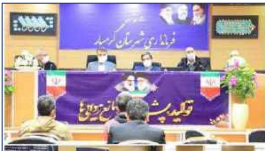
برگزاری برنامه آموزش اصول و مبانی پدافند غیرعامل در شهرستان گرمسار ۱۴۰۰/۱۱/۰۶