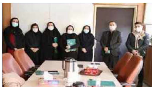
مراسم تقدیر از مددکاران اجتماعی بیمارستانهای تابعه دانشگاه برگزار شد ۱۴۰۰/۱۱/۲۵