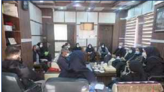
برگزاری جلسه کارشناسان تجهیزات پزشکی دانشگاه علوم پزشکی سمنان با معاون غذا و دارو دانشگاه ۱۴۰۰/۱۱/۱۰