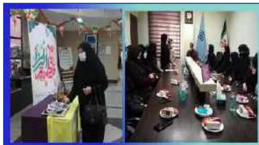
برگزاری جشن ولادت حضرت فاطمه زهرا (س) در مراکز بهداشتی، درمانی و آموزشی دانشگاه ۱۴۰۰/۱۱/۰۶