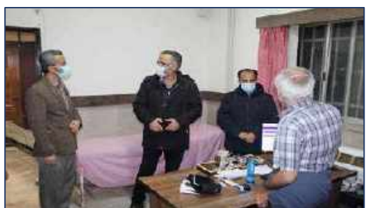
بازدید سرزده مدیر شبکه بهداشت و درمان دامغان از مراکز درمانی شهرستان ۱۴۰۰/۱۱/۱۶