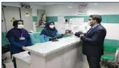
گرامیداشت میلاد حضرت فاطمه زهرا (س) در بیمارستان ولایت شهرستان دامغان ۱۴۰۰/۱۱/۰۵