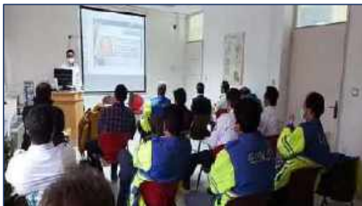
دومین کارگاه آموزشی مدیریت پیش بیمارستانی بیماران ترومایی PHTM ۱۴۰۰/۱۱/۱۳