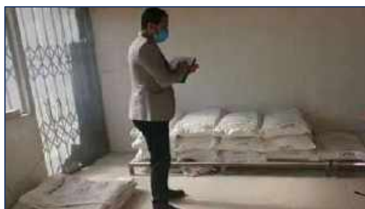
بازدید کارشناسان معاونت غذا و دارو دانشگاه از نانویی های سطح شهر سمنان ۱۴۰۰/۱۱/۱۹