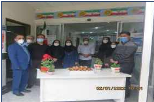
برگزاری جشن گرامیداشت پیروزی انقلاب اسلامی در معاونت غذا و دارو دانشگاه ۱۴۰۰/۱۱/۱۳