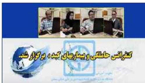
کنفرانس حاملگی و بیماریهای کبد برگزار شد ۱۴۰۰/۱۱/۰۵