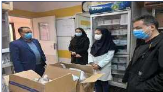
بازدید معاون غذا و دارو دانشگاه علوم پزشکی استان سمنان از داروخانه بیمارستان کوثر سمنان ۱۴۰۰/۱۱/۳۰