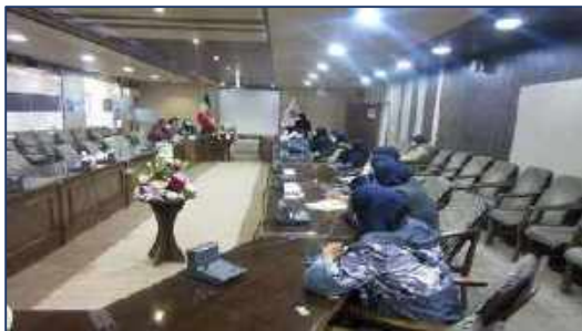
برگزاری نشست رئیس و کارشناسان مرکز بهداشت شهرستان

سمنان با موضوع واکسیناسیون کرونا ۱۴۰۰/۱۱/۲۳