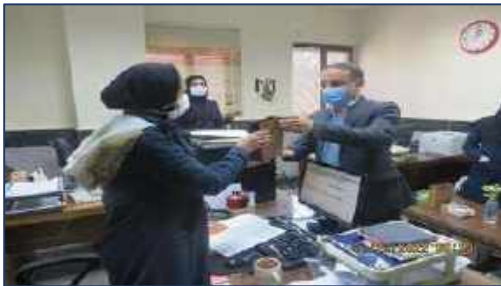
بزرگداشت سالروز ولادت حضرت فاطمه زهرا (س) و قدردانی از بانوان شاغل در معاونت غذا و دارو دانشگاه علوم پزشکی استان سمنان ۱۴۰۰/۱۱/۰۵