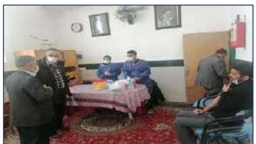
استقرار تیم سیار واکسیناسیون کرونا شبکه بهداشت و درمان دامغان، در مسجد جامع محل برگزاری نماز عبادی سیاسی جمعه ۱۴۰۰/۱۱/۱۷