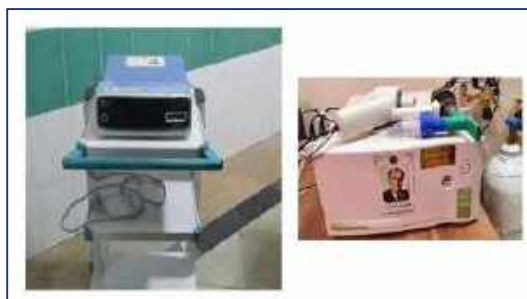
اهدا مبلغ ۵۳۰ میلیون تومان به موسسه خیریه بیمارستان کوثر سمنان ۱۴۰۰/۱۱/۱۹