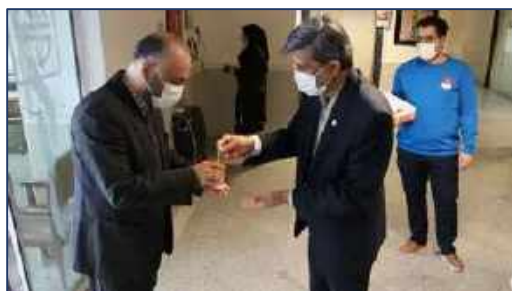
استقبال سرپرست دانشگاه از آقایان محترم دانشگاه به مناسبت ولادت حضرت امام علی (ع) ۱۴۰۰/۱۱/۲۵